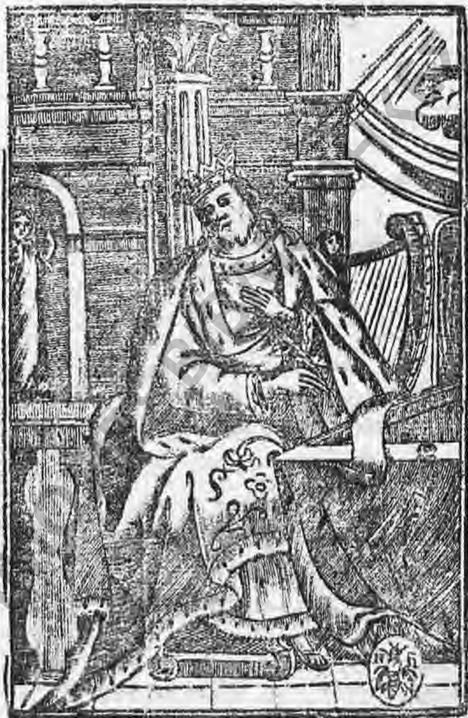
ΕΠΙΣΤΑΣΙΣ ΣΑΥΛ ΕΝ ΤΩ ΒΑΣΙΛΕΥΣΤΕΙΟΙΣ Βιβλιοθήκη Ξενοδοχείου "Μοναχίσσιο"