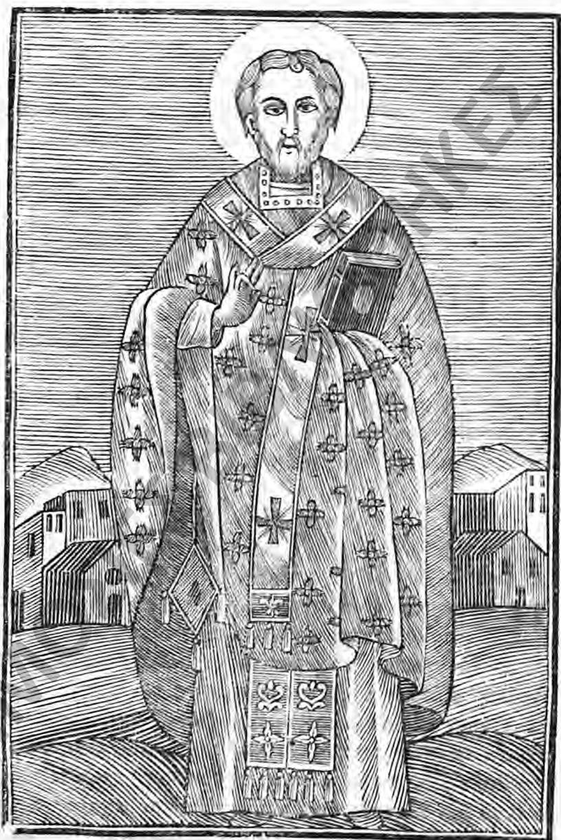
Ο ΑΓΙΟΣ ΓΡΗΓΟΡΙΟΣ.

Αγιόγραφον ἑκ τῆς ἐπιγραφῆς τοῦ ἁγίου Γρηγορίου