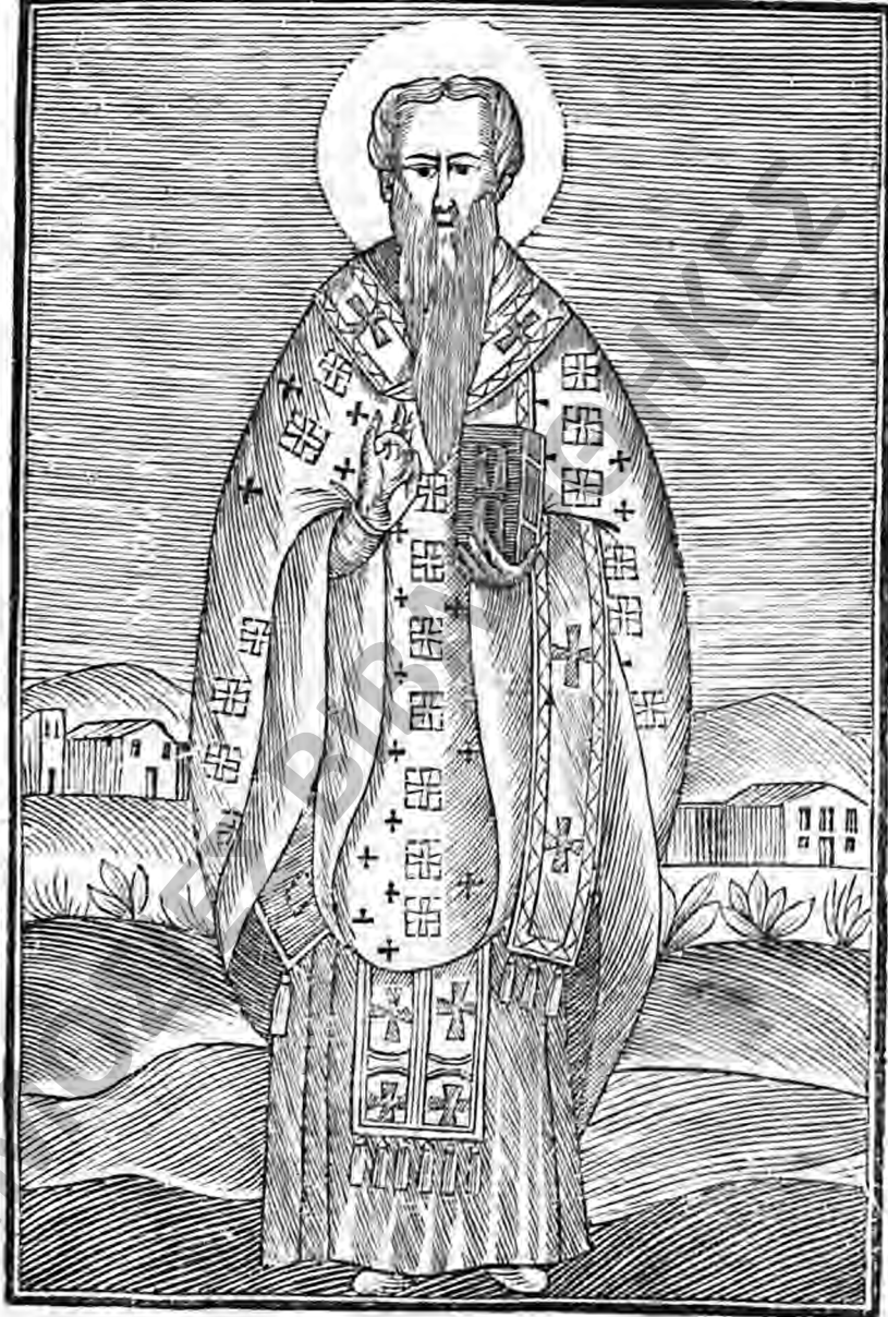
Ο ΑΓΙΟΣ ΒΑΣΙΛΕΙΟΣ Ο ΜΕΓΑΣ.

Αγία Βασιλεία Τεσσαράκων Β' Ελληνική Δημοκρατία