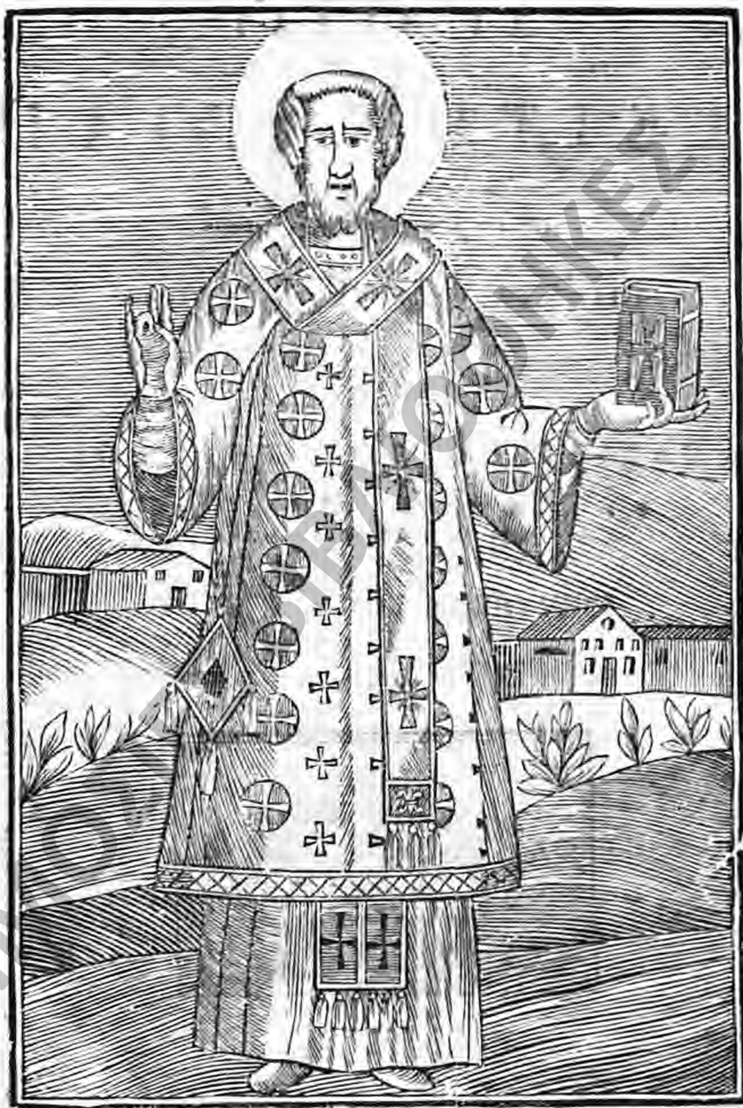
Ο ΑΓΙΟΣ ΙΩΑΝΝΗΣ Ο ΧΡΥΣΟΣΤΟΜΟΣ.

Δημιουργία: Γραφείο Τύπου "Εκδοτική Αθηνών"