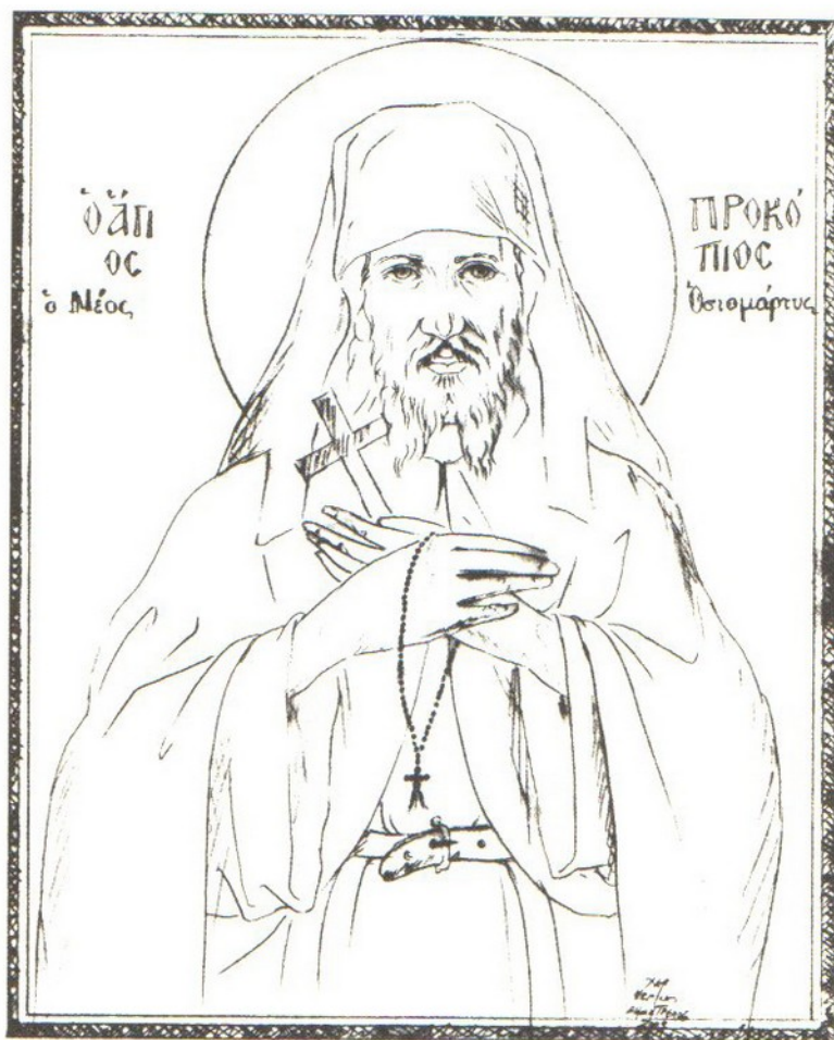
Ἔργον Κωνσταντίνου Δημητρέλου.