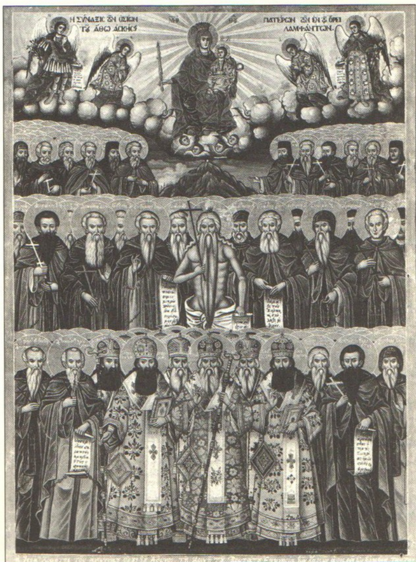
Σύναξις Ἀγιορειτῶν Πατέρων