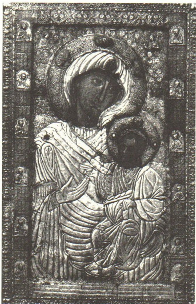
Παναγία Πορταΐτισσα. Ἐν τῇ Ἱερᾷ Μονῇ Ἰβήρων Ἅγιον Ὄρος.