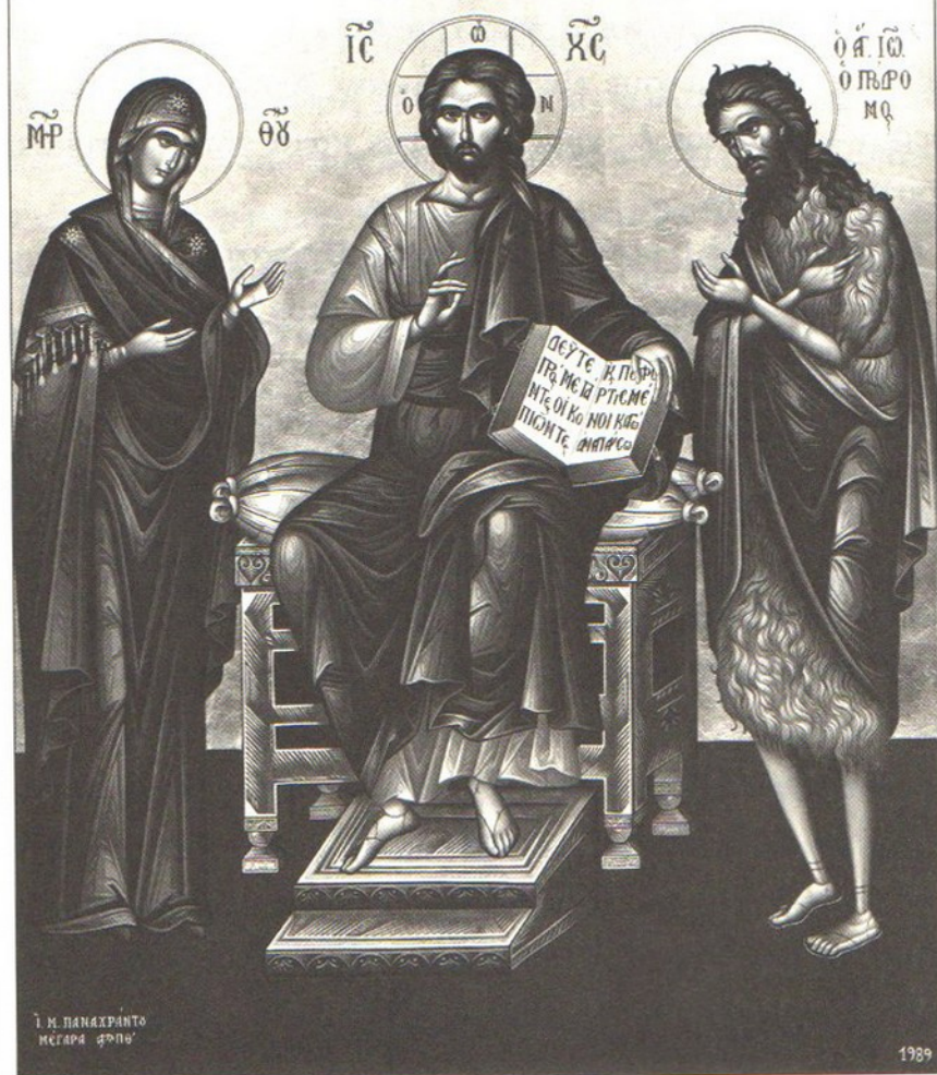
Τὸ Τρίμορφον. (Ἔργον Ἱ. Μ. Παναχράντου Μεγάρων).