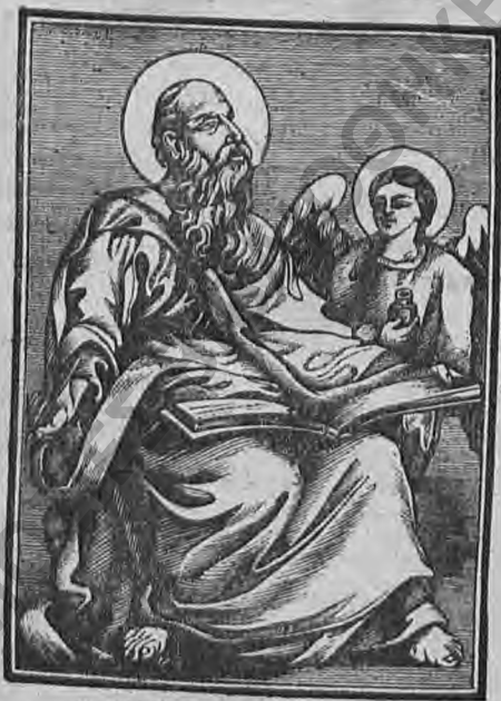
Ο ΕΥΑΓΓΕΛΙΣΤΗΣ ΜΑΤΘΑΙΟΣ