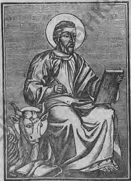
Ο ΕΥΑΓΓΕΛΙΣΤΗΣ ΛΟΥΚΑΣ