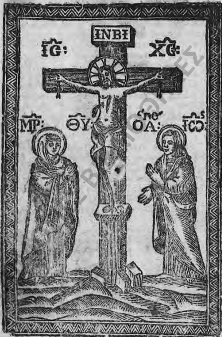
Δημόσια Κεντρική Βιβλιοθήκη Σιάτιστας "Μανοῦσσεια"