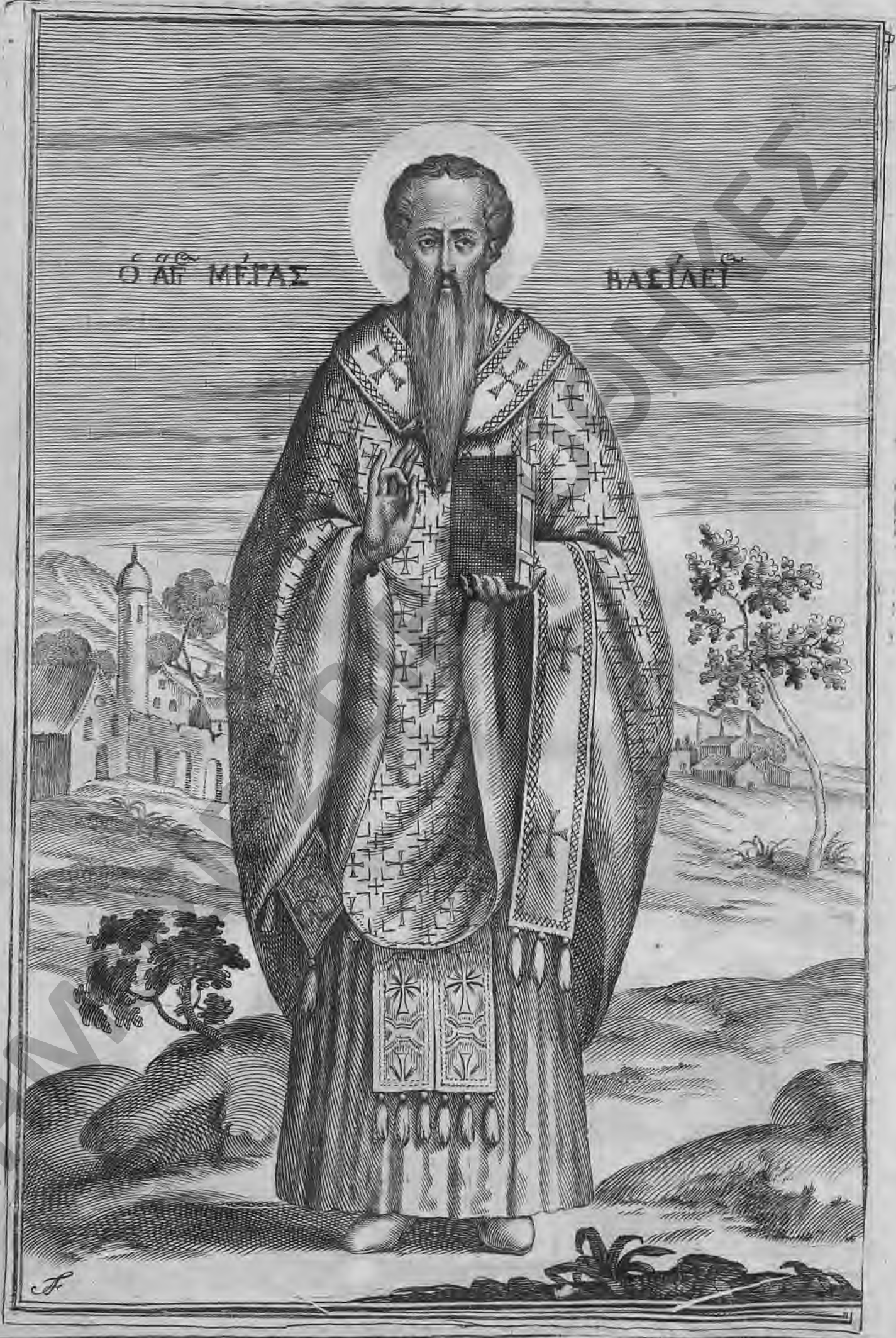
Δημόσια Κεντρική Βιβλιοθήκη Ληξουρίου - Μουσείο Τυπάλδων Ιακωβάτων