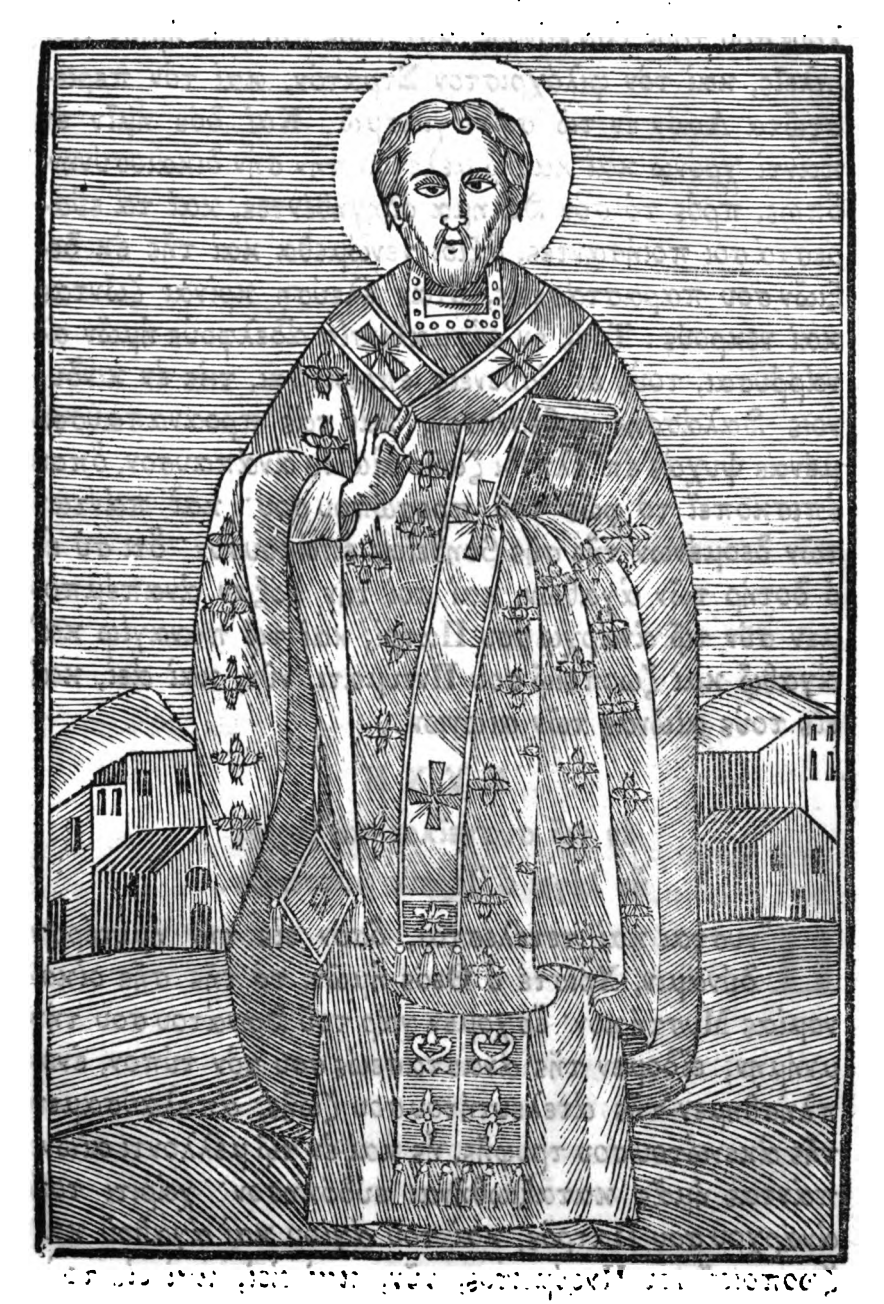
Ο ΑΓΙΟΣ ΓΡΗΓΟΡΙΘΣ