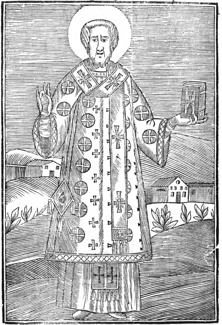
Ο ΑΓΙΟΣ ΙΩΑΝΝΗΣ Ο ΧΡΥΣΟΣΤΟΜΟΣ.