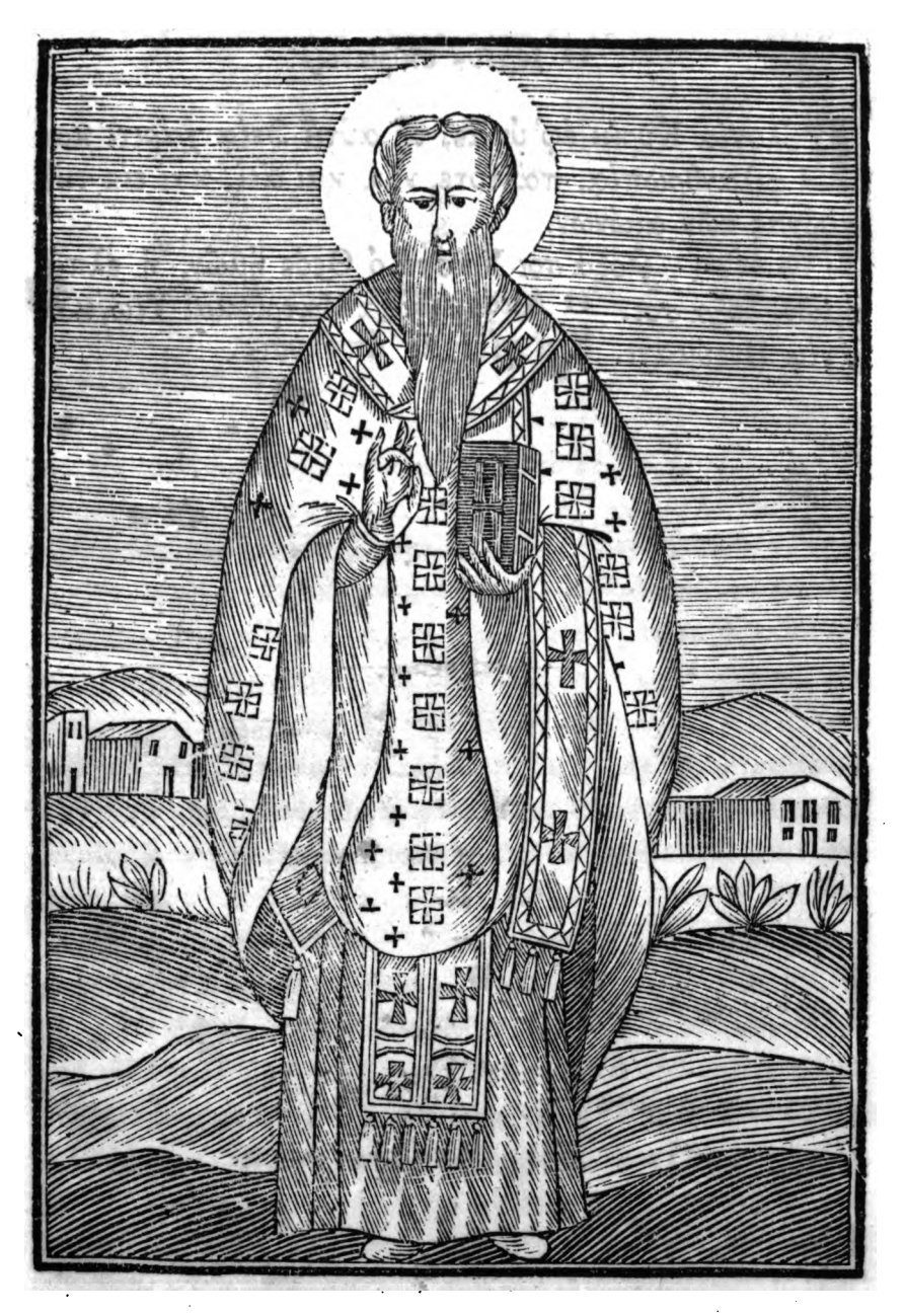
Ο ΑΓΙΟΣ ΒΑΣΙΛΕΙΟΣ Ο ΜΕΓΑΣ.